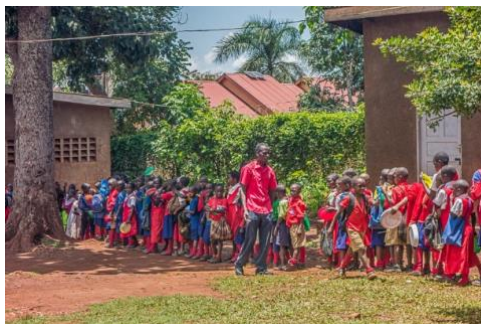
Repas à St Moses